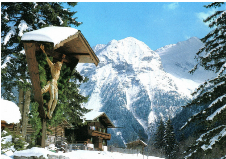
Luis Trenker-Kreuz in Bad Gastein

این اخطار کتاب آسمانی را فراموش نکنید که میفرماید: «امروز اگر صدای خدا را میشنوید، نسبت به آن بیاعتنا نباشید، مانند بنیاسرائیل که در بیابان نسبت به او بیاعتنا شدند.»